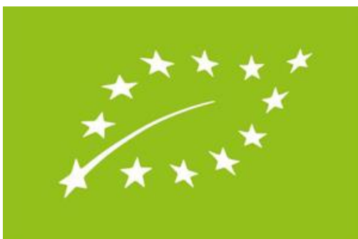
HR-EKO-13 EU poljoprivreda