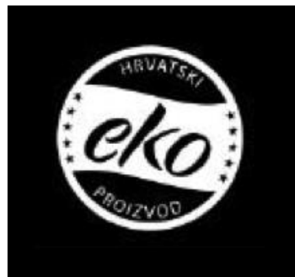
Hr eko znak negativ

Nacionalni znak ekološkog proizvoda je dozvoljeno koristiti pri označavanju, reklamiranju i prezentiranju ekoloških proizvoda. Sadržaj, izgled i veličina navedeni su u Pravilniku.