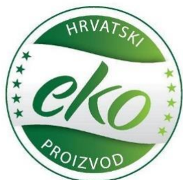
Hr eko znak u boji