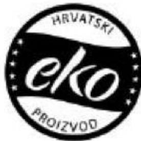
Hr eko znak crno bijeli